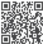
iOS VF Cam