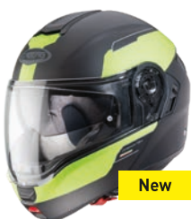
Levo Prospect Nero opaco/Giallo fluo