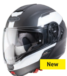
Levo Prospect Nero opaco/Bianco