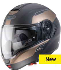
Levo Prospect Nero opaco/Bronzo

LEVO è il casco apribile di Caberg realizzato per il motociclista più esigente con soluzioni tecniche all'avanguardia e design innovativo.